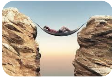
Entspannung & Erholung