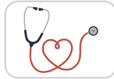
Personalarzt & Apotheke