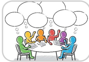
Workshops & Fortbildungen