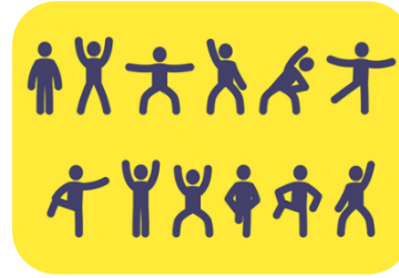
Sport & Bewegung