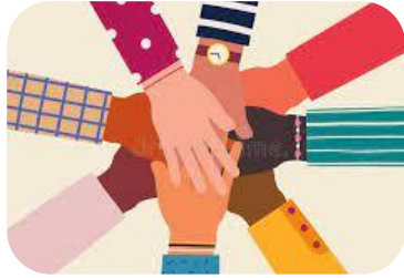
Beratung & Unterstützung