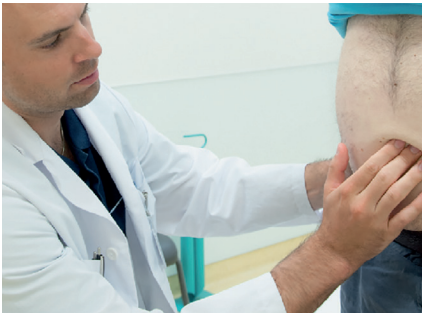
Klinische Untersuchung einer Nabelhernie.

In unserem Hernienzentrum begleiten wir in Zusammenarbeit mit Ihnen die Patienten mit Leisten-, Narben-, Schenkel-, Nabel- und Bauchwandbrüchen von der Abklärung bis zur Behandlung. Am Anfang steht grundsätzlich eine individuelle Beratung und Abklärung. Unsere Spezialisten beherrschen das gesamte Spektrum an minimalinvasiven und konventionellen Methoden und wenden patientenschonende Eingriffstechniken an. In der Abklärung von Schmerzzuständen der Bauchdecke und der Leiste sowie in der Behandlung voroperierter Patienten sind wir ausgebildet und technisch sowie wissenschaftlich auf dem neuesten Stand. Unsere Einsatzbereitschaft erstreckt sich auf 24 Stunden an 365 Tagen im Jahr, um auch in Notfällen für Sie und Ihre Patienten verfügbar zu sein.