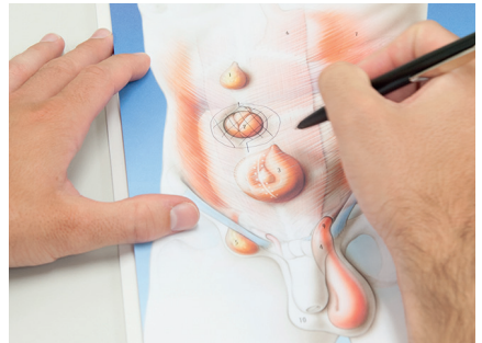
Das Aufklärungsgespräch ist wichtiger Bestandteil der Sprechstunde.